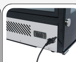
Basamento in acciaio inox con controllore digitale