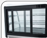
Porte scorrevoli posteriori