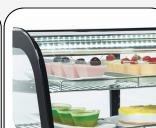
Luce LED interna